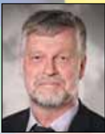
Af Karsten Nonbo